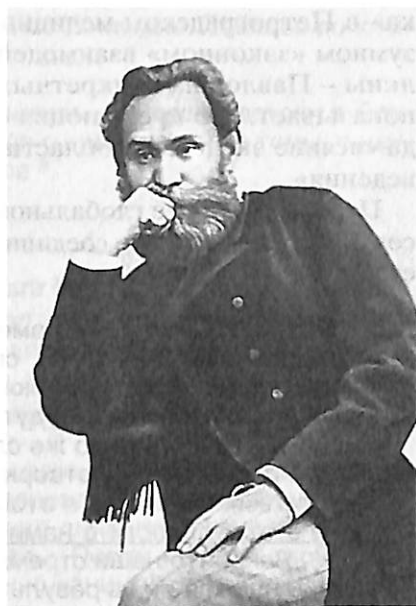
И. П. Павлов в конце 1880-х гг.

Сегодня идеи Павлова по наиболее общим фундаментальным проблемам – социально-культурного и политического развития России, его оценка политики властей относительно науки и ученых в жизни государства – актуальны как никогда. Ярким и убедительным свидетельством служит его позиция в вопросе о взаимодействии народов России, прежде всего двух братских народов – русского и украинского. В разгар гражданской войны в мае 1919 г. в лекции «Основы культуры поведения животных и челове-