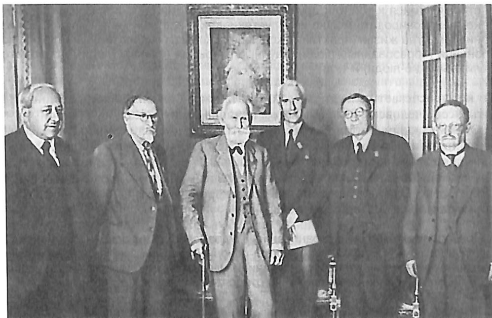
И. П. Павлов с выдающимися физиологами – участниками XV Международного физиологического конгресса. Слева направо: (?), Луи Лапик, И. П. Павлов, Арчибальд Хилл, Уолтер Кеннон, Отто Франк

существование прямого соотношения между затрачиваемой энергией и важностью цели, Павлов говорил о том, что сплошь и рядом на совершенно пустые цели тратится огромная энергия и наоборот. Человек нередко действует с «одинаковым жаром» как для великой, так и пустой цели. В связи с чем необходимо отделить самый акт стремления от смысла и ценности цели. Подчеркивая особенно яркое проявление «рефлекса цели» в страсти коллекционирования, Павлов связывает вопрос о его происхождении с общим инстинктом жизни. Жизнь направлена на осуществление одной цели – сохранение самой жизни, самосохранение. В основе инстинкта жизни заложены положительные двигательные рефлексы, имеющие целью использовать благоприятные для жизни условия, использовать эти условия для сохранения жизни, т. е. хватательные рефлексы. Самые сильно выраженные среди них – это пищевой и ориентировочный (исследовательский) рефлексы. В результате ежедневной и неустанной работы, тренировки этих рефлексов в процессе эволюции выработался и наследственно укрепился обобщающий хватательный рефлекс в отношении всякого предмета, ставшего временным раздражителем. Проводя параллель между типическим «рефлексом цели» – коллекционированием, и главным хватательным пищевым рефлексом, Павлов подчеркивает общее между ними – стремление к объекту, периодичность рефлекса.