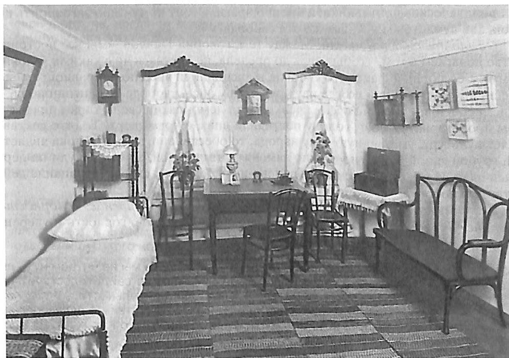
Интерьер комнаты И. П. Павлова в доме-музее в Рязани

яркий пример неотступного думания, Павлов приводил творчество И. М. Сеченова. Открыв в 1862 г. центральное торможение, Сеченов не расставался с думами о нем до конца жизни. В одном из писем 1890 г. он писал: «Самая удачная из всех лекций 21 , читанных мною за последние долгие годы – всего больше порадовал меня конец – удался опыт с угнетением рефлексов в самой что ни на есть резкой и доказательной форме – при абсолютном покое животного угнетение столь сильное, что отрезывание лам ножницами не дает и признаков движения» 22 . Свидетельство Н. Е. Введенского, ученика И. М. Сеченова по Петербургскому университету. «Случилось так, что учитель не появлялся в лаборатории 2–3 дня. Все беспокоились. На вопрос Введенского “Вы были больны Иван Михайлович?” последовал ответ: “Нет, меня страшно занимает один вопрос, занимает настолько, что я не могу спать и боюсь сойти с ума”. Из моих распросов выяснилось, что его занимала теория состава легочного воздуха» 23 .