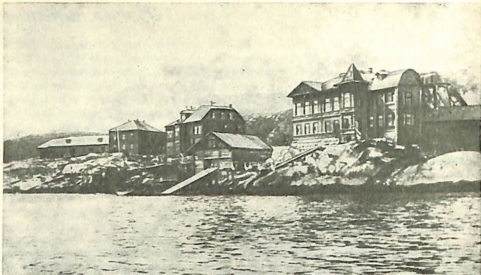
Мурманская биологическая станция. Фото 30-х годов

Мурманская биологическая станция. Г. А. Клюге принял нас радушно, и мы все разместились на станции.