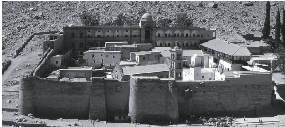
Рис. 1. Монастырь Св. Екатерины.

на корабле по Дунаю и Черному морю до Константинополя. Оттуда через Мраморное море выходили в Средиземное и, пройдя острова Хиос и Родос, направлялись в Египет. После посещения святых мест вместе с караванами через пустыню шли в Иерусалим 6 .