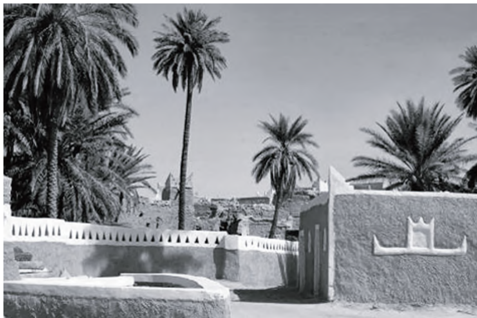
Рис. 5. Гадамес.

исследователь изучал также ее флору и фауну. Елисеев пришел к выводу, что «ее ландшафт (пустыни Сахары. — В. Р.) не представляет собою совершенно безжизненной пустыни» 85 . Елисеев насчитал 15 видов млекопитающих. Домой он возвращался через Лиссабон и всю Европу.