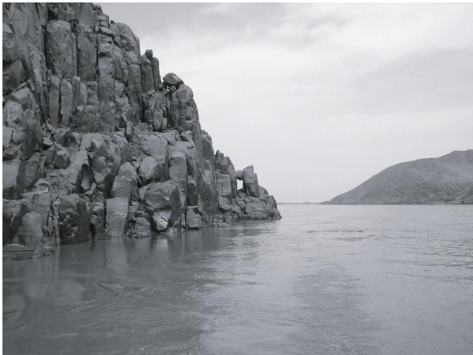
Рис. 4. Среднее течение реки Нил.

по Нилу вплоть до границ Эфиопии 50 . Свои записки он опубликовал под псевдонимом «Барон Брамбеус».