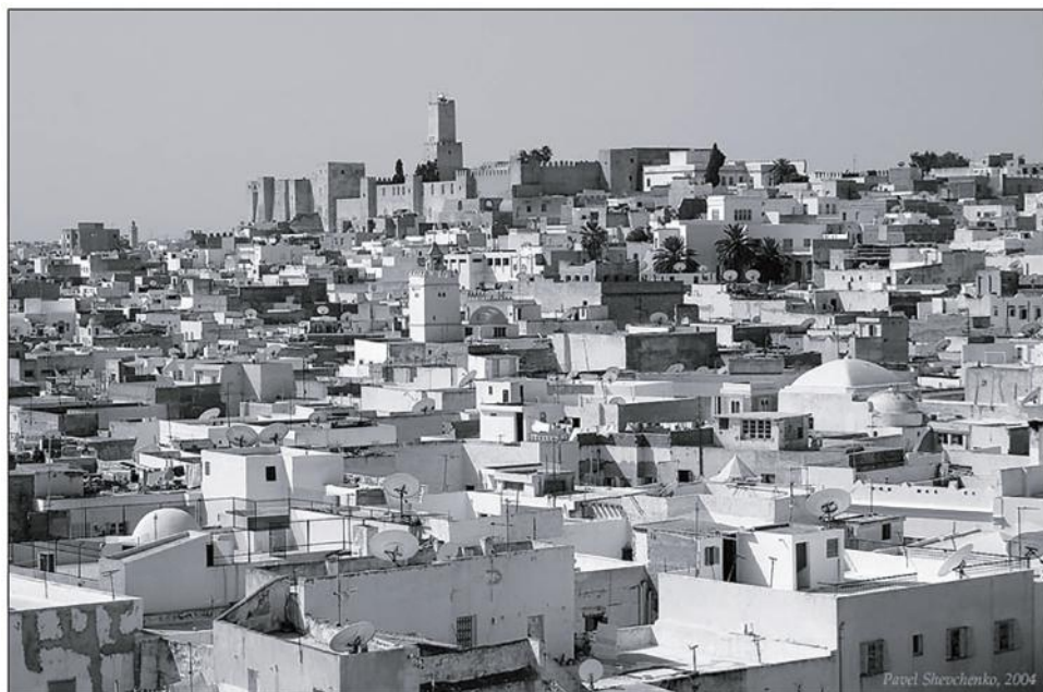
Рис. 3. Тунис.

воспоминаний об Алжире 27 . Коковцев, возможно, первым из русских путешественников по-настоящему занимался в Африке научными исследованиями. Он внес «первую лепту отечественной картографии в уточнение карт Африки» 28 . Кроме того, Коковцев опубликовал свои наблюдения за время пребывания в Тунисе. Советский историк М. О. Косвен назвал его «первым русским африканистом» 29 .